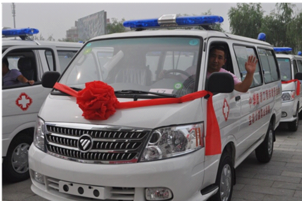
图为“思源宝塔公益基金”2014年7月4日捐赠救护车的照片

2、8月3日地震发生后，“思源工程”即组织“芭莎公益慈善基金”、“思源宝塔公益基金”和“思源仁慧公益基金”，用分别捐赠给地震灾区会泽县中医院、会泽县妇幼保健院和彝良县人民医院的3辆思源救护车投入紧急生命救援、伤者转送及救治工作。